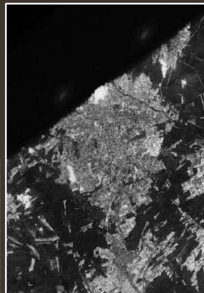
Zielona Góra sfotografowana przez amerykańskiego satelitę. 23 sierpnia 1965 r.[1]